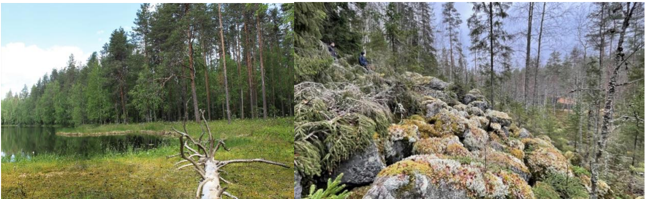
Pentti Linkolan muistometsä, lammen puoli.

Toimintavuonna säätiö osti kaksi uutta suojelualuetta ja sai yhden alueen lahjoituksena. Elokuussa ostettiin yhteishankintana Luonnonperintösäätiön kanssa Toivakasta Riuttasalon kiinteistö Pentti Linkolan muistometsäksi. Hankinta sai merkittävää julkisuutta mediassa. Jylhän Riuttasalon koko on 76 hehtaaria, sisältäen myös erämaalammen. Muistometsäksi rajattiin luonnontilaisiin osa, 43 hehtaaria.