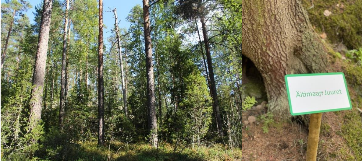
Pirttivuoren metsä (kuvat: vasen Marjo Kuisma, oikea Niko Nappu).

Joulukuussa säätiön omistukseen siirtyi Sysmän Saarenkylästä noin 40 hehtaarin Pirttivuoren metsä. Alue on valtaosin luonnontilainen, ja siellä kulkee opastettu luontopolku. Alueeseen kuuluu myös vanhaa niittyä, jossa laiduntavat lähitulallisen kyytöt.