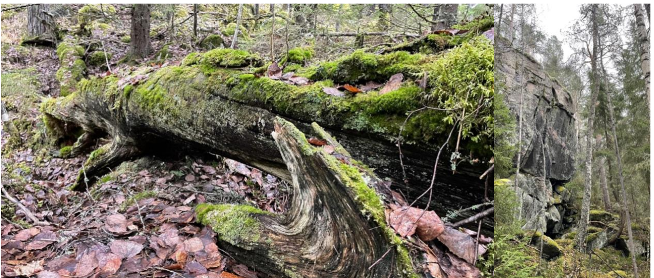
Pentti Linkolan muistometsä, maapuuta ja Loppasenvuoren jyrkäne.